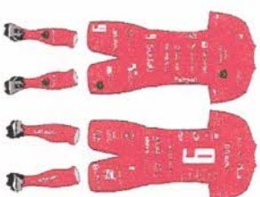
Linha (TODA VERMELHA)