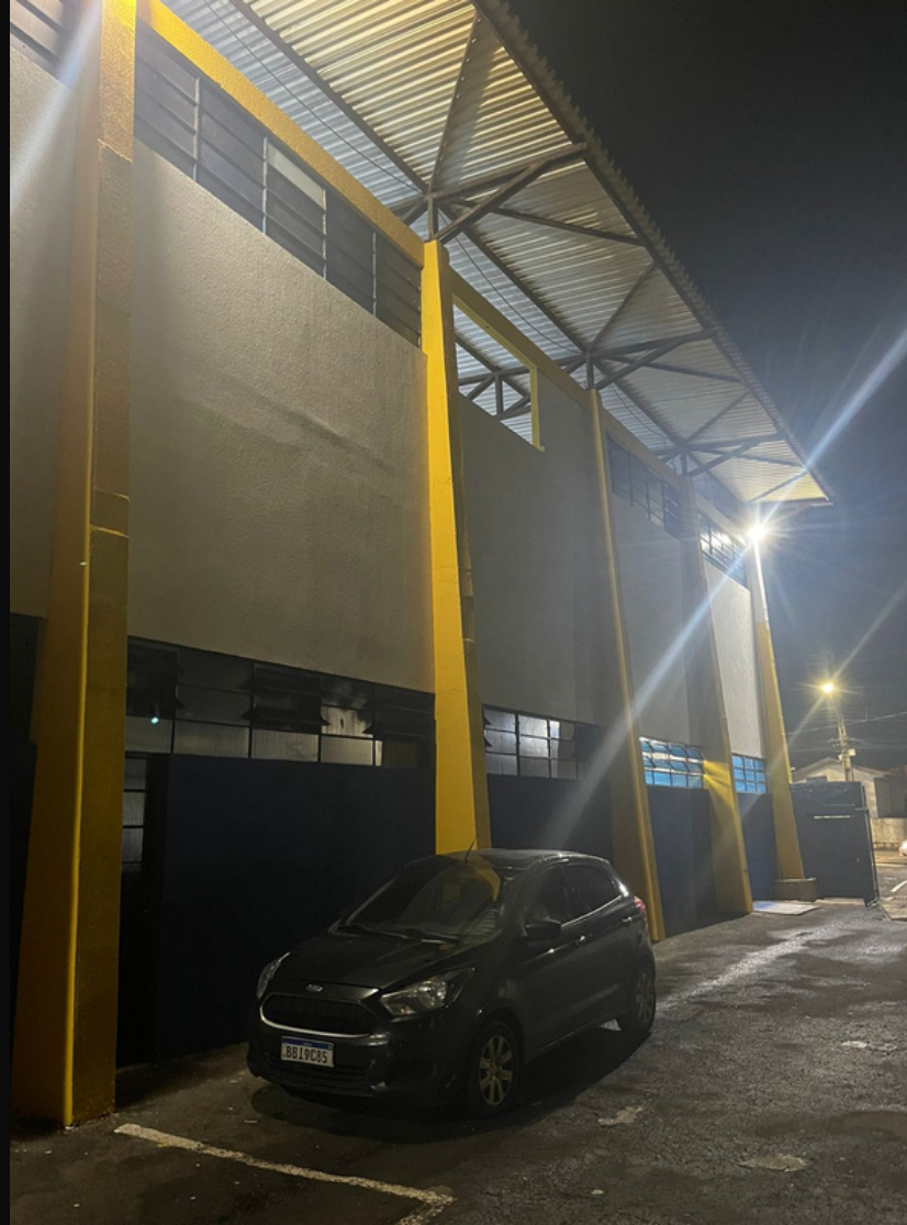
IMAGEM NO GINÁSIO 1